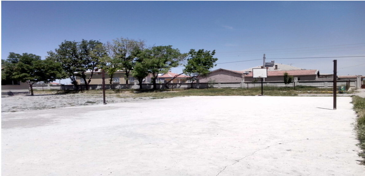
Resim-4 Okul bahçesindeki voleybol sahamız