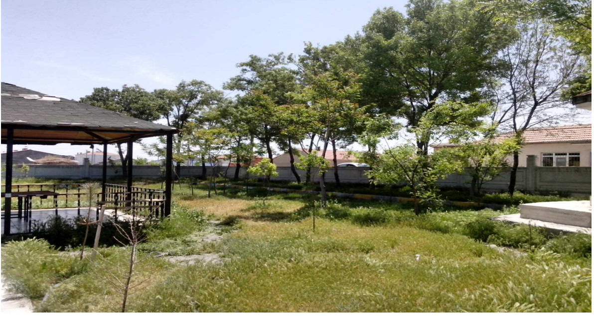
Resim-5 Okul bahçesindeki ağaçlandırma sahamız