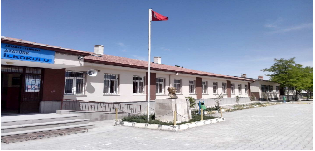
Resim-1 Okulumuz A Blok Binası

Okulumuz 1976 yılında 5 derslikli ilkokul olarak faaliyete girmiştir. Kasabamızın 2. ilkokuludur. Kasabanın tek ilkokulu olan Yenikent Kasabası İlkokulu ihtiyaca cevap veremez hale gelince yeni bir okul yapılması kararlaştırılmış ve vatandaş devlet işbirliği ile tamamlanmış ve 1976 yılından itibaren eğitim öğretime başlamıştır.