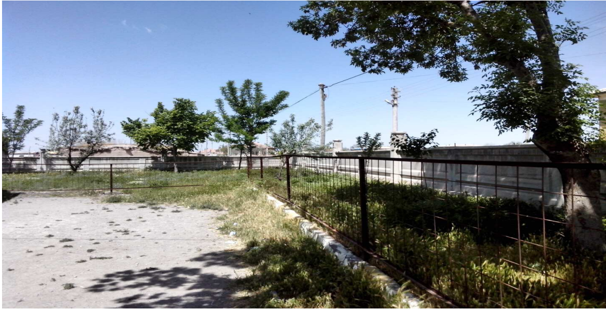
Resim-3 Okulumuz yeşil alanlarından bir kesit

Okulumuzun içinde bulunduğu arsa 6400 metrekare yüz ölçümüne sahiptir. Bu alanın 594 metre karesini A blok binası, 400 metre karesini de B blok binası işgal etmektedir. Geriye açık alan olarak 5406 metre kare alan kalmaktadır. Bu açık alanın bir kısmında voleybol sahamız, bir kısmında ağaçlandırma sahamız bulunmaktadır. Okulumuz iki adet binadan oluşmaktadır. A blok binası 2007 yılı rakamları ile arsa bedeli dahil 225.750 TL'ye mal olmuştur. 2007 Eylül ayında hizmete girmiştir. B blok binası 1976 yılında hizmete girmiştir. A blok binasında 1,2,3. sınıflar, kazan dairesi, anasınıfı, öğretmenler odası, müdür odası, kız ve erkek öğrenci tuvaletleri ile bay ve bayan öğretmenler tuvaleti bulunmaktadır. B blok binasında, 3 ve 4. sınıflar, araç gereç odası, arşiv ve müdür yardımcısı odası bulunmaktadır.